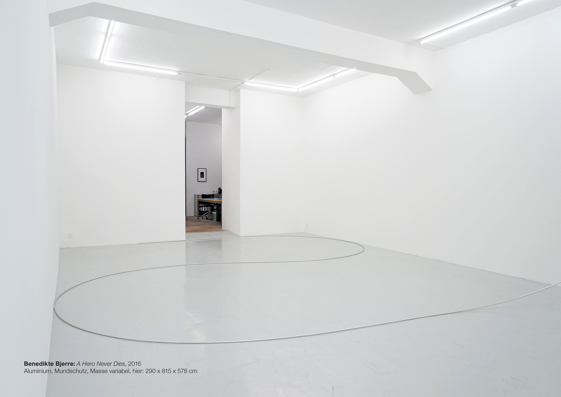
Benedikte Bjerre: A Hero Never Dies , 2016 Aluminium, Mundschutz, Masse variabel, hier: 290 x 815 x 578 cm