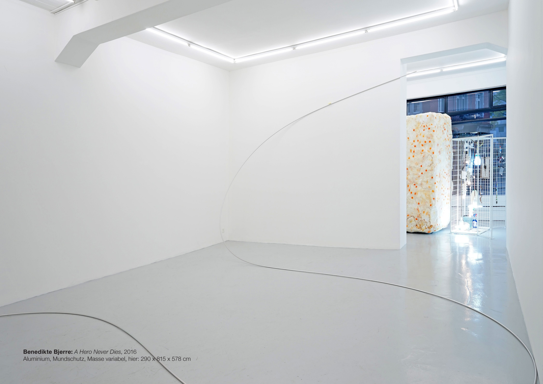
Benedikte Bjerre: A Hero Never Dies , 2016 Aluminium, Mundschutz, Masse variabel, hier: 290 x 815 x 578 cm