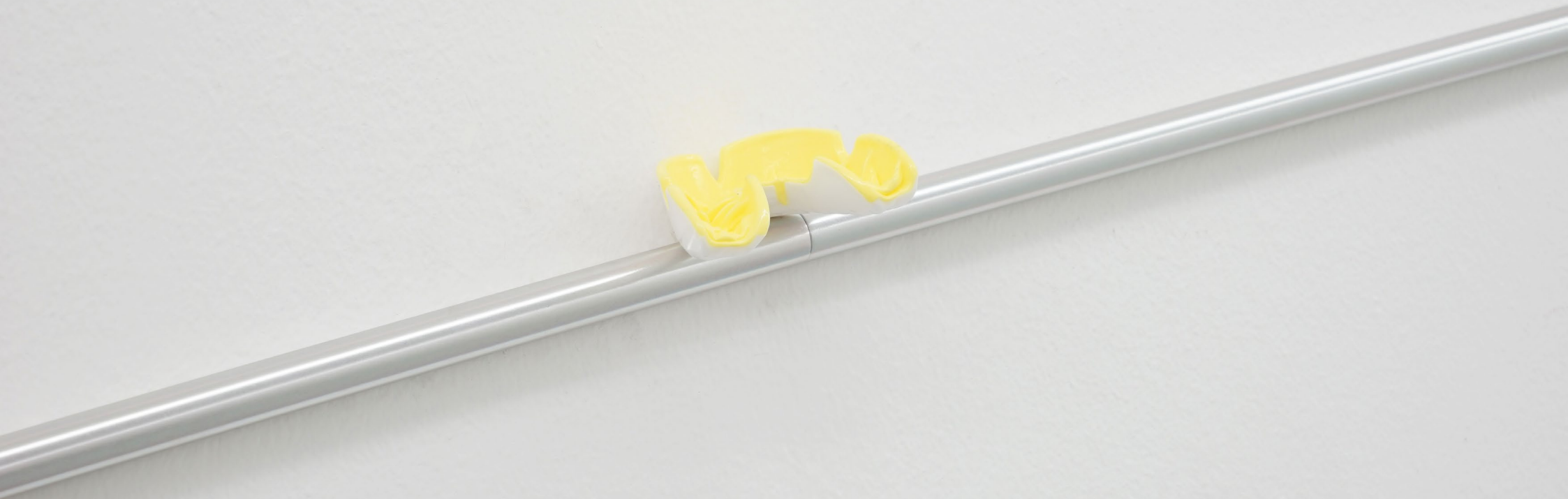
Benedikte Bjerre: A Hero Never Dies , 2016 – Detail