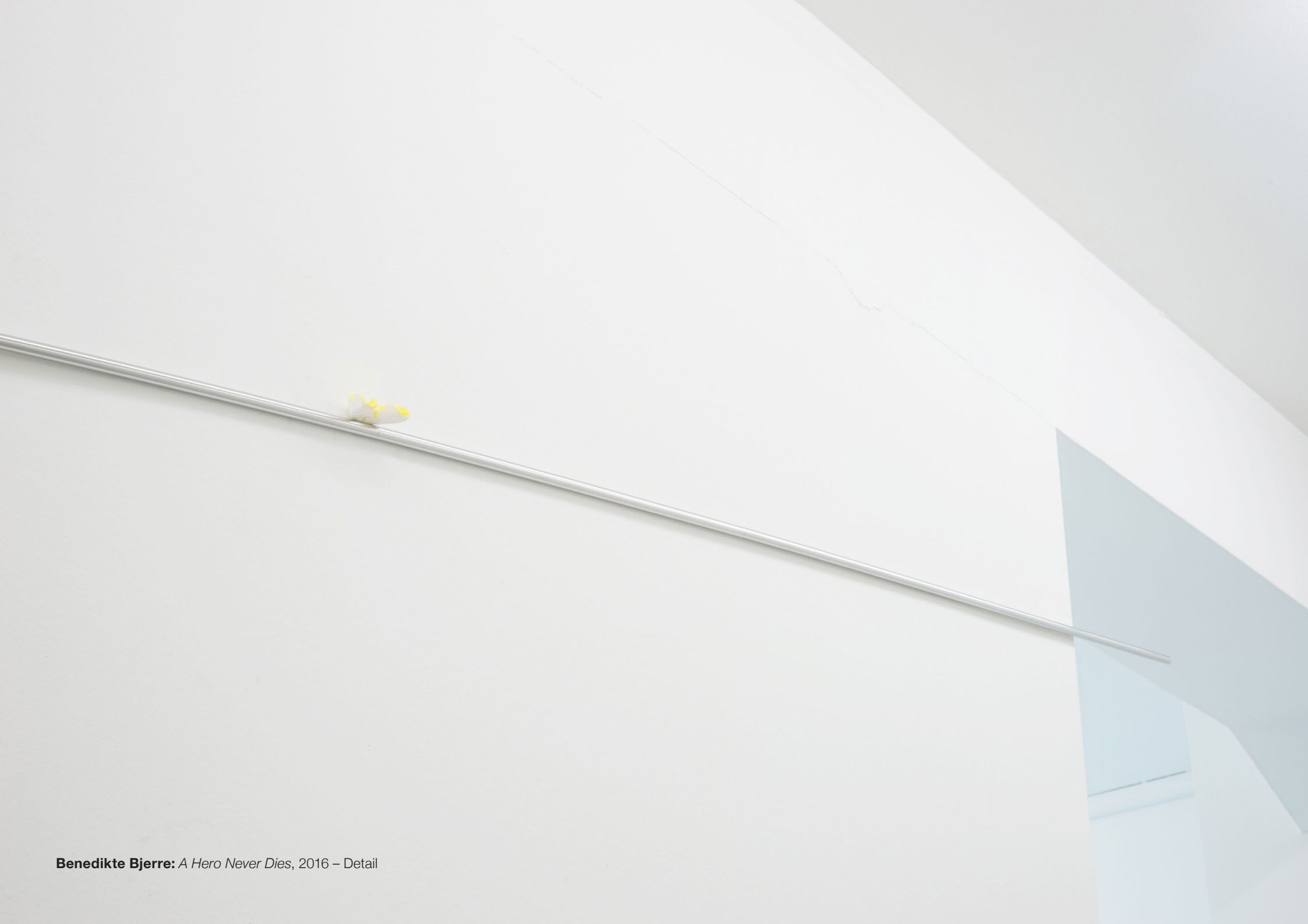
Benedikte Bjerre: A Hero Never Dies , 2016 – Detail