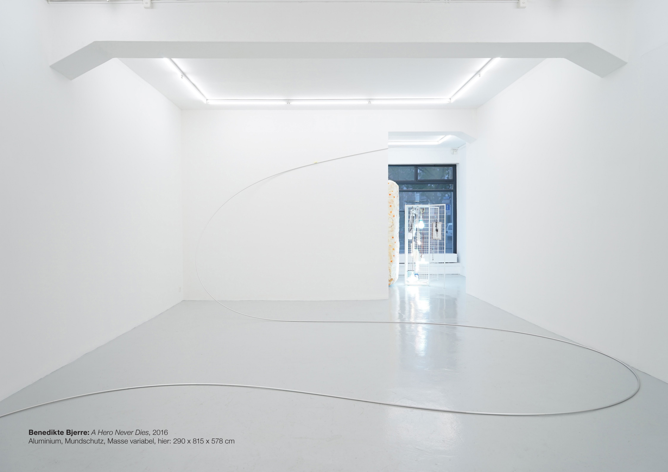
Benedikte Bjerre: A Hero Never Dies , 2016 Aluminium, Mundschutz, Masse variabel, hier: 290 x 815 x 578 cm